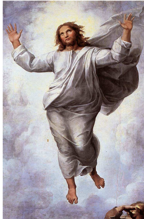
fragm., 1518-20, olejny na desce, Pinacoteca, Watykan

Jezus wziął z sobą Piotra, Jana i Jakuba i wyszedł na górę, aby się modlił. Gdy się modlił, wyglądał Jego twarz się odmienił, a Jego odzienie stało się lśniącym białym. A oto dwóch mężów rozmawiało z Nim. Byli to Mojżesz i Eliasz. Ukazali się oni w chwale i mówili o Jego odejściu, którego miał dokonać w Jerozolimie. Tymczasem Piotr i towarzysze snem byli zmorzeni. Gdy się ocknęli, ujrzeli Jego chwałę i obydwoch mężów, stojących przy Nim.