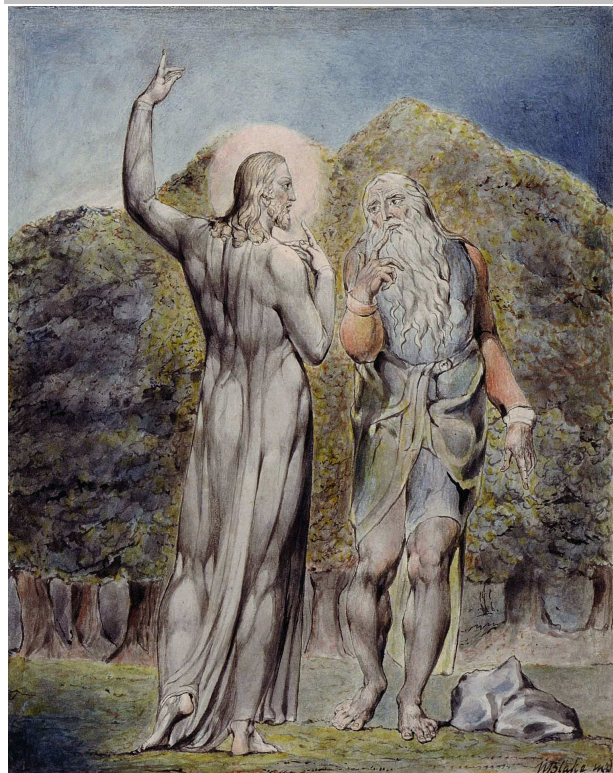
PIERWSZE KUSZENIE. BLAKE, William (1757. Londyn - 1827. Londyn). 1816-20, ilustracja do „Raju utraconego” Miltona, farby wodne, Fitzwilliam Museum, Cambridge