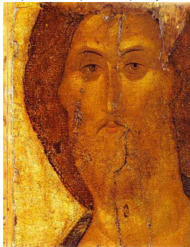
Pius XI, encyklika Quas primas, o ustanowieniu święta Chrystusa Króla, 1925, fragmenty il. NASZ ZBAWCA, RUBLOW, Andriej (ok. 1360 - 1430, Moskwa), ok. 1420, fragment, tempera na desce, Galeria Tretiakowska, Moskwa

Chrystus jest ponadto Synem Bożym, naturą równy Bogu, drugą Osobą Trójcy Przenajświętszej. Jako taki jest Panem nieba i ziemi, Panem najwyższym i absolutnym, wobec którego wszelkie królestwa ziemskie są nieporównywalne. Aby to powszechne władztwo Jezusa podkreślić, liturgia dodała do tytułu "Król" dopełniacz "Wszechświata".