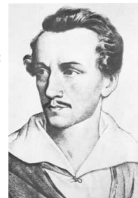
SŁOWACKI, Juliusz (1809, Krzemieniec - 1849, Paryż)

Skądkolwiek jego duch na mnie uderzy, Gdziekolwiek jego wołanie usłyszę - Czy to zjawi się w siermiączce pasterzy, Czy jeszcze w żłobku matka go kołysze, Gdziekolwiek ono dziecko światowładne Poczuję - klęknię i na twarz upadnę.