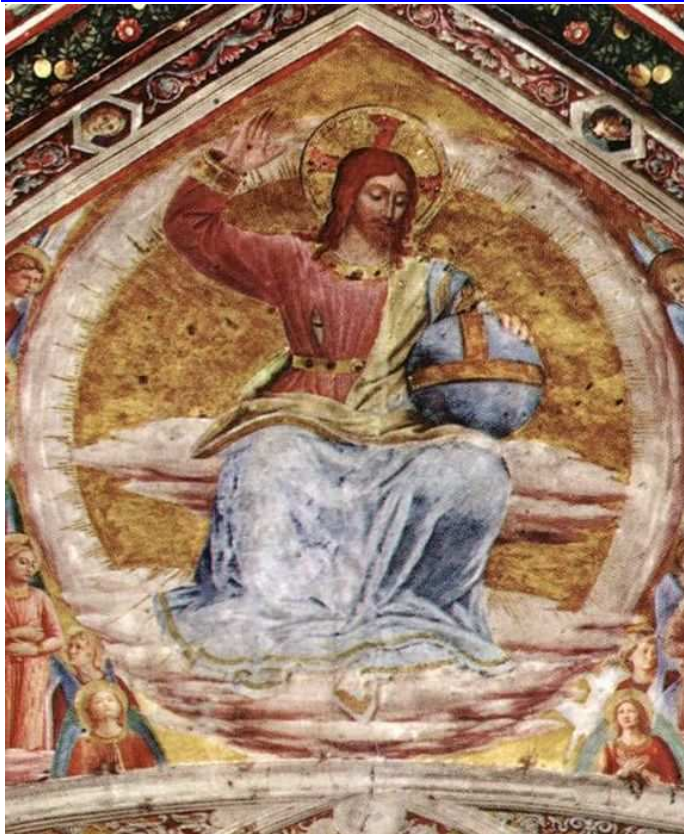
CHRYSZTUS SĘDZIA, ANGELICO, Fra (ok. 1400, Vicchio nell Mugello - 1455, Rzym), fragment, 1447, fresk, kaplica Madonny di San Brizio, katedra w Orvieto