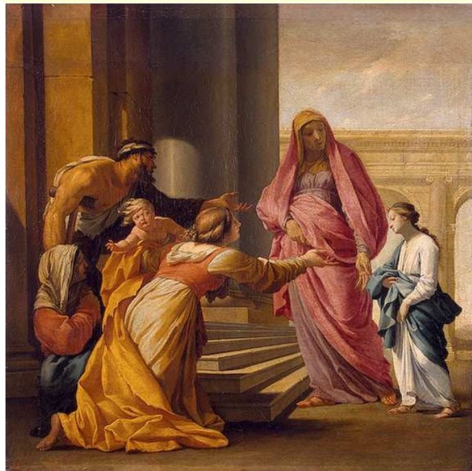
OFIAROWANIE DZIEWICY, SUEUR, Eustache le (1616/17, Paryż - 1655, Paryż), ok. 1641, olejny na płótnie, 102,5x101,6 cm, Ermitaż, St. Petersburg

W dawnych czasach istniał wśród Żydów zwyczaj religijny, polegający na tym, że dzieci - nawet jeszcze nienarodzone - ofiarowywano służbie Bożej. Dziecko, zanim ukończyło piąty rok życia, zabierano do świątyni w Jerozolimie i oddawano kapłanowi, który ofiarowywał je Panu. Zdarzało się czasem, że dziecko pozostawało dłużej w świątyni, wychowywało się, uczyło służyć dla sanktuarium, pomagało wykonywać szaty liturgiczne i asystowało podczas nabożeństw.