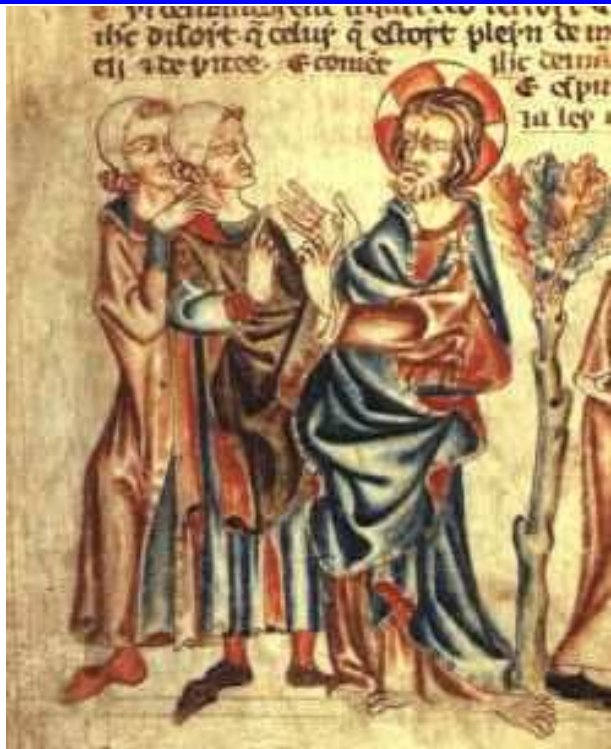
DWÓCH FARYZEUSZY PYTAJĄCYCH CHRYSZTUSA O NAJWIĘKSZE PRZYKAZANIE. miniatura, z "Ilustrowanej Biblii Holkham", Anglia, ok. 1320-30, British Library, Londyn