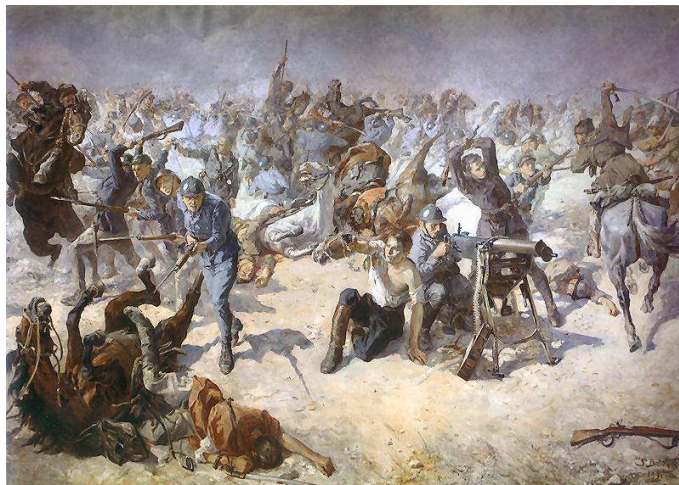
POLSKIE TERMOPILE, KACZOR BATOWSKI, Stanisław (1866, Lwów – 1946, Lwów), 1929, Muzeum Wojska Polskiego, Warszawa

ks. Jan TWARDOWSKI (1915, Warszawa – 2006, Warszawa)