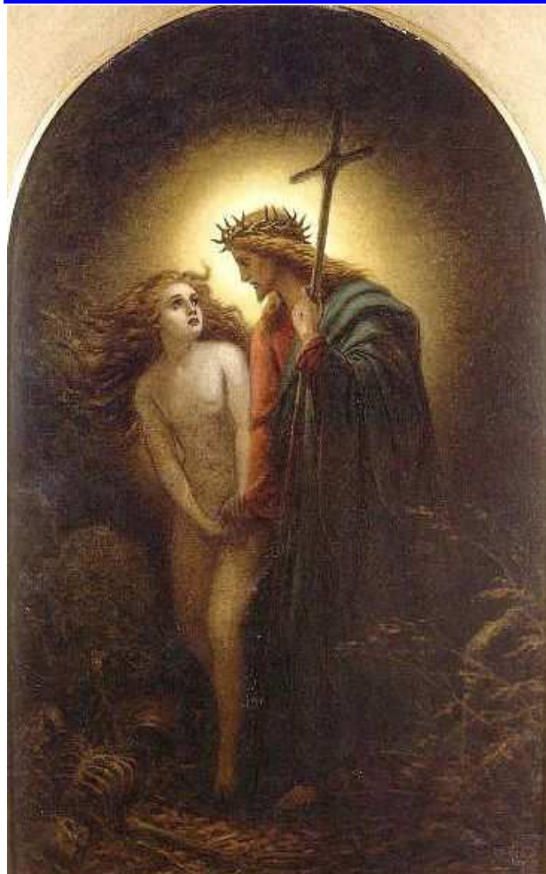
DOLINA CIENIA ŚMIERCI, PATRON, Joseph Noel (1821 Dunfermline – 1901, Edynburg), 1866, olejny na tekturze, 30,50x19 cm, Leicester Galleries, źródło www.leicestersgalleries.com

TRZYDZIESTA NIEDZIELA ZWYKŁA: ROCZNICA KONSEKRACJI KOŚCIOŁA