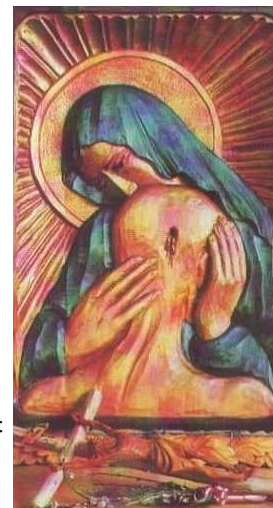
Jacek KACZMARSKI (1957, Warszawa – 2004, Gdańsk), 1982

Armia Czerwona wyruszyła A cóż to za historia nowa? Zdumiona spyta Europa Jak to? - To chłopcy Mołotowa I sojusznicy Ribentropa Zwycięstw się szlak ich serią znaczył Sztandar wolności okrył chwałą Głowami polskich posiadaczy Brukują Ukrainę całą Pada Podole, w hołdach Wołyn Lud pieśnią wita ustrój nowy Płoną majątki i kościoły I Chrystus z kulą w tyle głowy Nad polem bitwy dłonie wzniosą We wspólną pieść, co dech zapiera Nieprzeliczone dzieci Soso Niezwycięzony miot Hitlera Już starty z map wersalski bękart Już wolny Żyd i Białorusin Już nigdy więcej polska ręka Ich do niczego nie przymusi Nową im wolność głosi "Prawda" Świat cały wieść obiega w lot Że jeden odtąd łączy sztandar Gwiazdę, sierp, Hackenkreuz i młot Tych dni historia nie zapomni Gdy stary ład w zdumieniu zastygł I święci będą wam potomni Po pierwszym wrześnie - siedemnasty