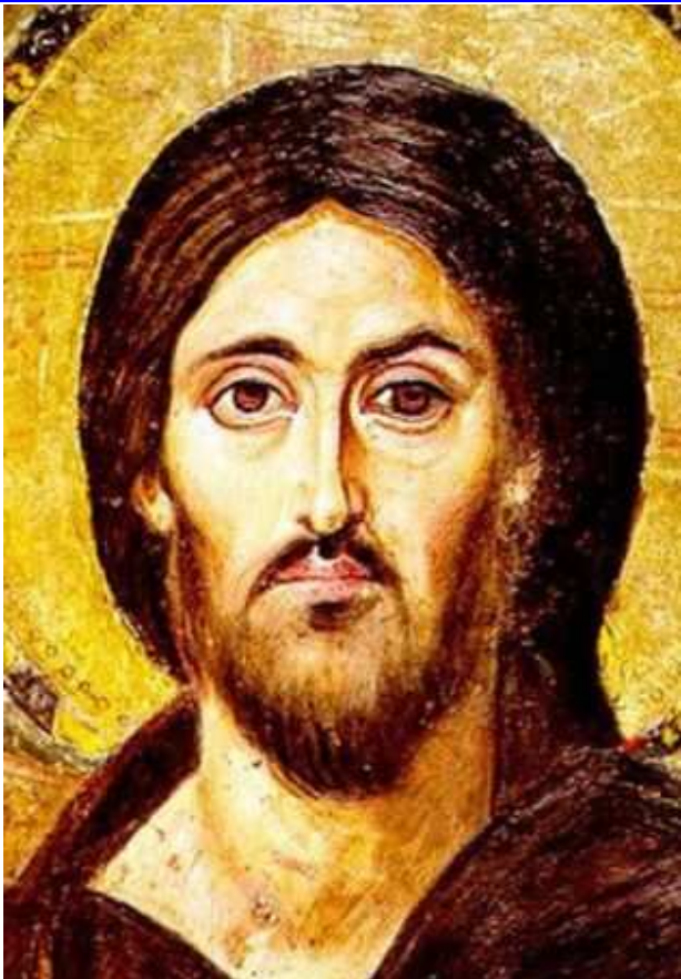
CHRYSTUS PANTOKRATOR, ok. 550, ikona, fragment, 85x45cm, monastyr św. Katarzyny, Synaj, Egipt