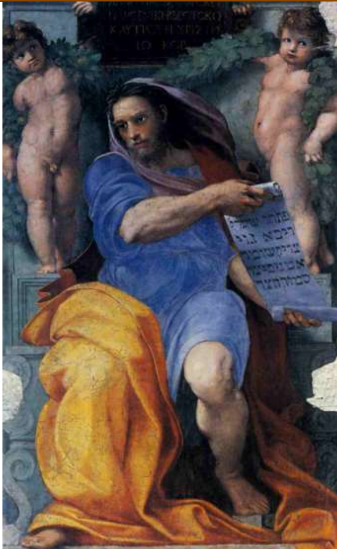
PROROK IZAJASZ — RAFFAELLO SANZIO (1483, Urbino – 1520, Rzym)

1511-2, fresk, 250×155 cm, bazylika pw. Św. Augustyna (w. Sant'Agostino), Rzym