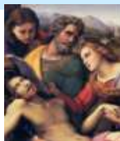
HERBERT, Zbigniew (1924, Łódź - 1998, Warszawa)

TKANINA... Bór nici wąskie palce i krosna wierności oczekiwania ciemne flukta więc przy mnie bądź pamięci krucha udziel swej nieskończoności