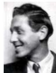
GAJCY, Tadeusz (1922, Warszawa – 1944, Warszawa)

I szepnie - śpiewaj, szepnie - idź. Nie tobie lekkim słowem kochać, lecz stać nad czasem tym jak krzyż i znaku czekać znów w obłokach. Bo jestem tutaj płodnym pyłem, by miłość rosła, kiedy runą, i trwoga wielka, gdy zabijając będą wpatrzni w zbrojne jutro