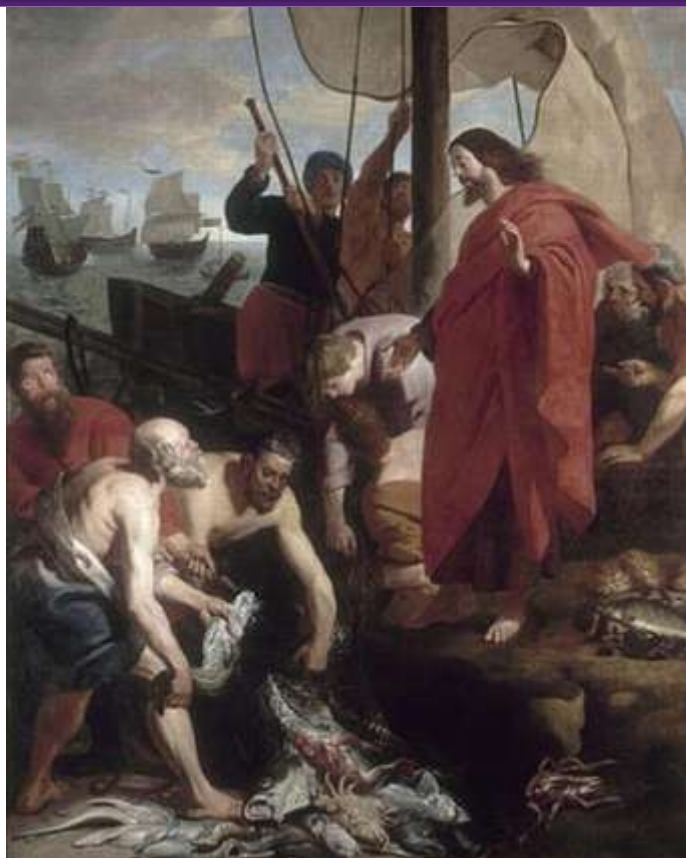
CUDOWNY POŁÓW RYB: CRAYER, Kacper de (1584, Anvers – 1663, Gand), ok. 1650-60, olejny na płótnie, 47,6×32,6 cm, Musée des Beaux-Arts, Lille; źródło: www.museo.gov.it