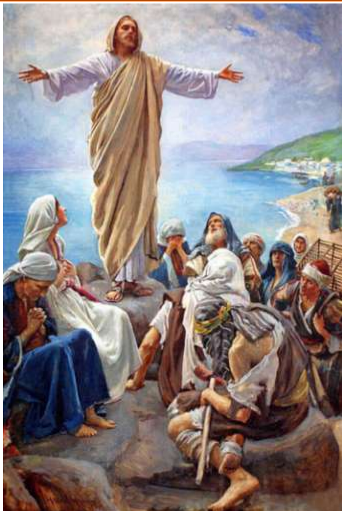
PRZYJŹDZIE DO MNIE WSZYSCY, COPPING, Harold (1863–1932, Sevenoaks?), 1910?, z tzw. „Biblii Coppinga”