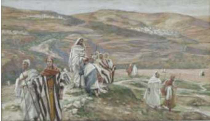
WYŚLĄ ICH PO DWÓCH, Tissot, James Joseph Jacques (1836, Nantes – 1902, Buillon), 1886-1894, farby wodne na podkładzie grafitowym na szarym papierze, 14,6x24,8 cm, Brooklyn Museum, Nowy Jork; źródło: www.brooklynmuseum.org