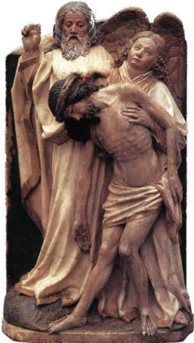
TRÓJCA ŚWIĘTA, MULTSCHER, HANS (ok. 1400, Reichenhofen/Allgäu - 1467, Ulm), ok. 1430, alabaster, częściowo malowany, 28,5x16,3 cm, Liebighaus, Frankfurt