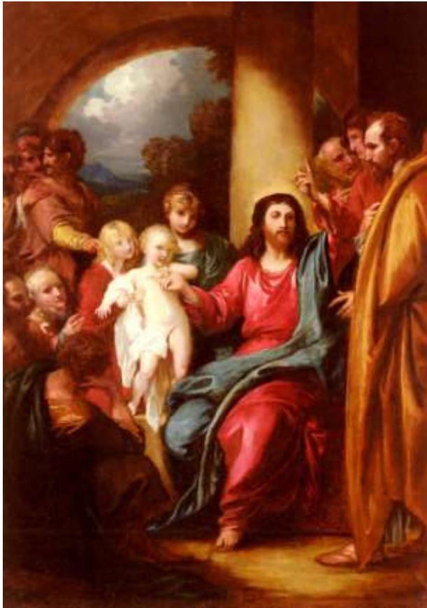
CHRYSTUS UKAZUJĄCY DZIECKO JAKO SYMBOL NIEBOS, WIEŚT. BENJAMIN (1738, Springfield, US.-1820, Londyn, UK), 1790, olejny na płótnie, 70x50,5cm, własność prywatna; źródło www.artrenewal.org