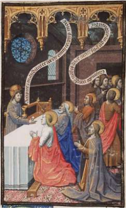
CHRYSTUS UDZIELAJĄCY KOMUNII APOSTOŁOM. MAÎTRE, François, ok. 1475-80; miniatura w: ręczna kopia Biblii, 120x80 mm. Museum Meermanno Westreenianum, Haga; źródło collecties.meermanno.nl