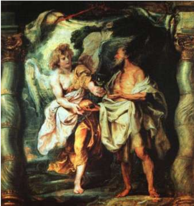
ANIOŁ I PROROK ELIASZ, RUBENS, Pieter Pauwel (1577, Siegen - 1640, Antwerpia), 1625-28, olejny na płótnie, Musée Bonnat, Bayonne; źródło www.wga.hu

Powtórnie anioł Pana wrócił i trącając go, powiedział: „Wstań, jedz, bo przed tobą długa droga!” Powstałszy zatem, zjadł i wypił. Następnie mocą tego pożywienia szedł czterdzieści dni i czterdzieści nocy, aż do Bożej góry Horeb.