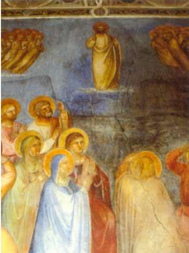
WNEBOWSTĄPIENIE, GIUSTO DE MENABUOI (ok. 1320, Florencia - 1391, Florencia), 1376-78, fresk, katedra w Padwie