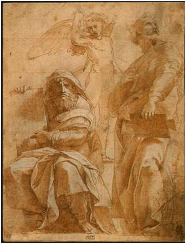
PROROCY OZEASZ I JONASZ, RAFFAELLO, Sanzio (1483, Urbino -1620, Rzym), ok. 1510, tusz i kreda na papierze, 26,2 x 20 cm, kolekcja Armada Hammera, National Gallery of Art

„Chcę przynęcić niewierną oblubienicę, na pustynię ją wyprowadzić i mówić do jej serca. I będzie mi tam uległa jak za dni swej młodości, gdy wychodziła z egipskiego kraju. I poślubię cię znowu na wieki, poślubię przez sprawiedliwość i prawo, przez miłość i miłosierdzie. Poślubię cię sobie przez wierność, a poznasz Pana”.